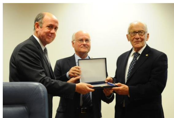
Entrega do título de Associado Honorário à Santa Casa da Misericórdia de Braga

Importa relevar que a Santa Casa da Misericórdia de Braga, 500 anos depois de ser criada, continua a dedicar-se de forma permanente ao bem-estar dos mais