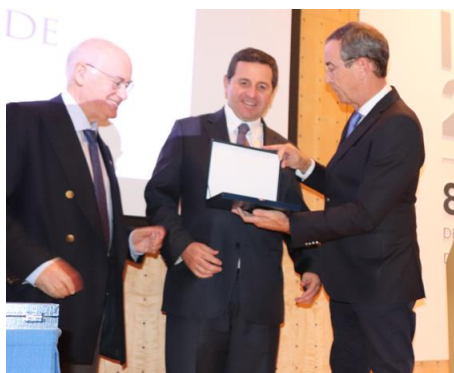
Entrega do título de Associado Honorário ao Grupo José de Mello Saúde