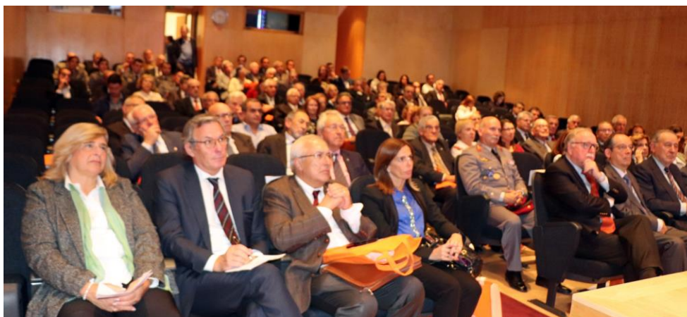
Vista geral da Assistência

Só Farmácias são já 80 protocoladas em todo o País.