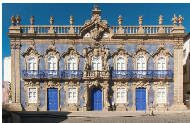
Fachada principal do Palácio do Raio

DATA: 29 de outubro de 2018, com início às 15h00